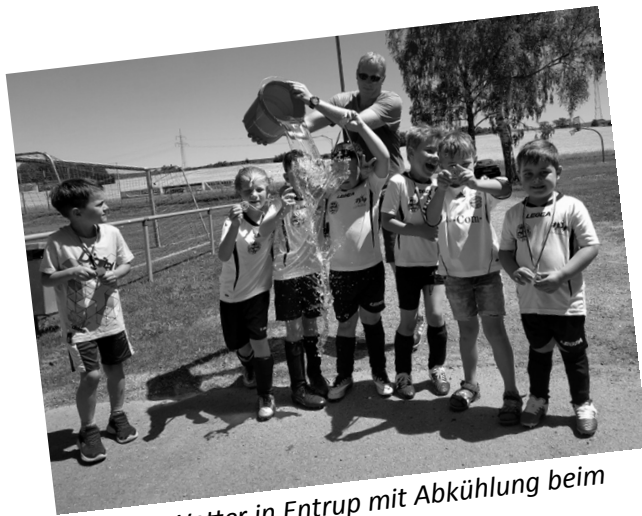
Heisses Wetter in Entrup mit Abkühlung beim Mannschaftsfoto